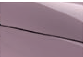
Coral Pink (nur für Comfort erhältlich)