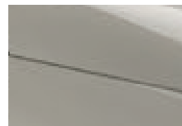
Cream White (nur für Comfort erhältlich)