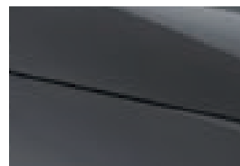
Urban Grey (nur für Comfort erhältlich)