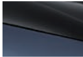
Jet Black + Atlantis Grey (nur für Design erhältlich)