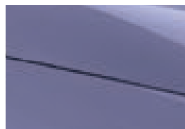
Amethyst Purple (nur für Comfort erhältlich)