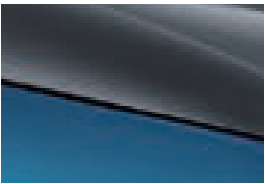
Surfing Blue + Urban Grey (nur für Design erhältlich)